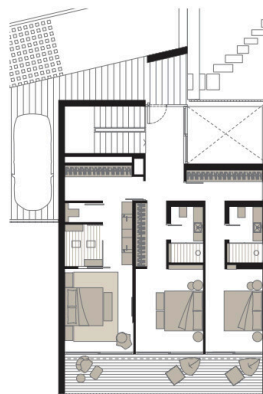
Planta piso (1)